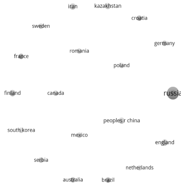
شکل ۴. کشورهای دارای بیشترین پژوهشگر در موضوع تصاویر آینده

شکل ۴ بیانگر این است که کدام کشورها دارای بیشترین پژوهشگران در موضوع تصاویر آینده می‌باشد.