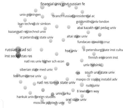
شکل ۳. بیشترین وابستگی سازمانی پژوهشگران موضوع با تصاویر آینده

شکل ۳ نشان‌دهنده سازمان‌هایی که دارای بیشترین نویسندگان در بین پژوهشگران موضوع با تصاویر آینده می‌باشد.