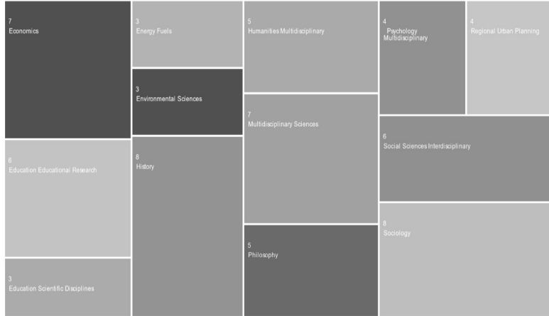
شکل ۱. حوزه‌های پرکاربرد پژوهش‌های مربوط به تصاویر آینده

شکل ۱ حوزه‌های پرکاربرد پژوهش‌های علمی با موضوع تصاویر آینده را نشان می‌دهد.