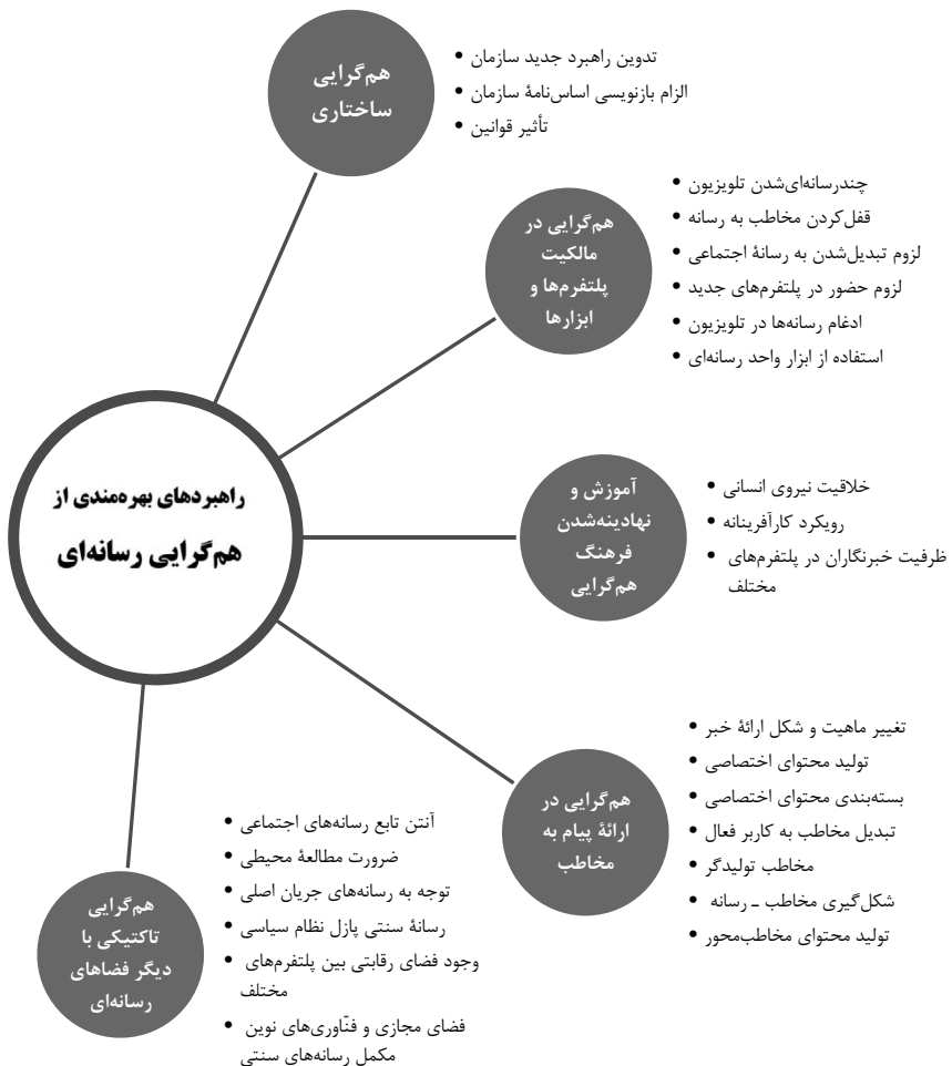
شکل ۲. راهبردهای بهره‌مندی از هم‌گرایی رسانه‌ای

پس از انجام فرایند کدگذاری باز و سپس کدگذاری محوری که به شناخت مضامین و استخراج مقولات منجر شد، فرایند کدگذاری انتخابی به منظور طبقه‌بندی و کشف ارتباط نظری بین مقوله‌های پژوهش و ترسیم شبکه مضامین آغاز شد. در این مرحله، با بررسی تمام مقوله‌های اصلی که طی فرایند کدگذاری محوری از بین کدهای اولیه استخراج شدند، پژوهشگر برای ترسیم شبکه مضامین و کشف ارتباط نظری بین مقوله‌های مختلف بر اساس مسئله و پرسش پژوهش و یافتن راهبردهای تحولی و مؤثر برای شبکه خبر پنج راهبرد محوری برای تبیین نتایج به دست آورد که در شکل 2 با مقوله‌های کشف شده در هر حوزه نمایش داده شده است.