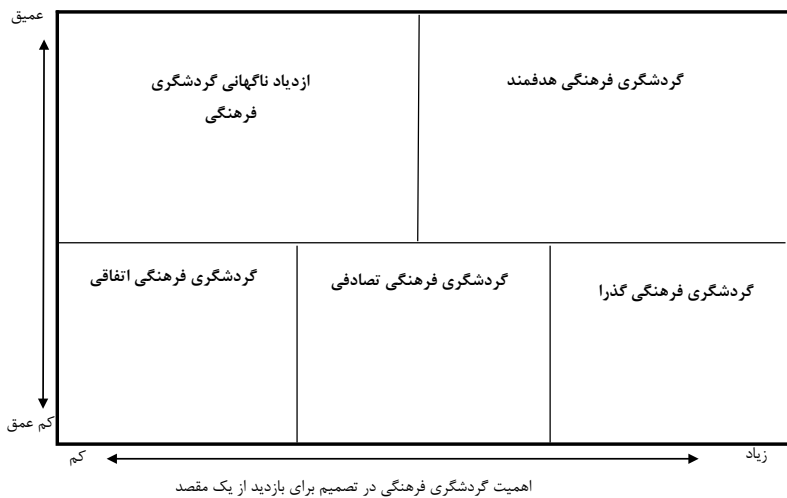
نمودار ۱. گردشگری فرهنگی (McKercher & Cros, 2002)

این مورد ارتباط نزدیکی با هویت ملی ما دارد که مردم را در سازمان‌های اجتماعی، محلی و ملی مانند دولت‌های محلی، نهادهای آموزش و پرورش، جوامع مذهبی، کار و فراغت و تفریح قرار می‌دهد (Raj, 2012). در نتیجه در چنین شرایطی چگونه فرهنگ می‌تواند ابزار و اهرمی در توسعه گردشگری محسوب شود؟ اولین گام در توسعه گردشگری فرهنگی در یک جامعه تعریف روشنی از فرهنگ آن جامعه و محصولات فرهنگی آن است. رایج‌ترین روش صورت‌گرفته در برخورد با گردشگری فرهنگی کاهش ناملموس یک محصول در بازار و ایجاد تمایز بین محصولات و تبدیل آن‌ها به محصولات مختلف و مرتبط با مفاهیم گردشگری میراث فرهنگی، گردشگری فرهنگی و گردشگری خلاق است. در خصوص محصولات گردشگری فرهنگی، هرچه دیدگاه‌ها و نظرها به سمت وسوی متمرکز کردن محصولات گردشگری فرهنگی در کالاهای خاص متمایل شود، به همان اندازه باعث معرفی گردشگری فرهنگی به‌عنوان تولید فرهنگی خواهد شد (نمودار ۱). در این مدل، شاخص‌های مورد استفاده تجربه و اهمیت گردشگری فرهنگی در تصمیم برای بازدید از یک مقصد است.